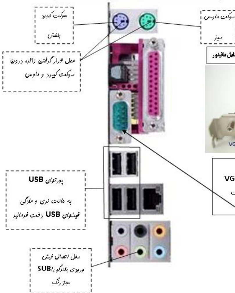
شکل ۲: نمایی از محل اتصال کی برد، ماوس، پلنگو و فیش های USB