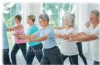
tai chi classes