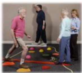
balance exercise for elderly

ANYTIME FITNESS Get to a healthier place.