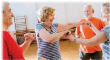
senior dance exercise

ANYTIME FITNESS Get to a healthier place.