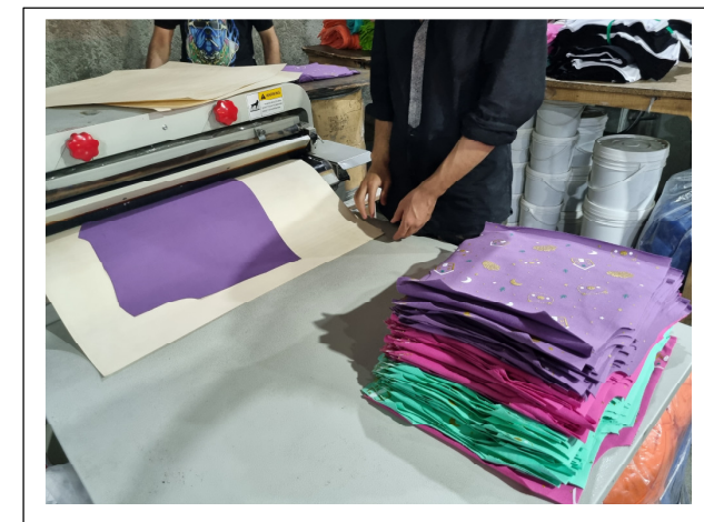
تهیه و تنظیم گزارش: نگار بیضایی دوست - مدرس درس چاپ مقدماتی