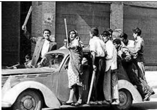
همراهی اوباش و فواحش در ایجاد هرج و مرج

چندی پیش بطور تصادفی یکی از برنامه های شبکه تلویزیونی "من و تو" را که از انگلیس پخش میشود دیدم در برنامه فوق مجریان برنامه دختران و زنان این سرزمین را تشویق به برداشتن حجاب به اسم آزادی و مبارزه با دیکتاتوری نظام دینی این سرزمین میکردند. و فیلم زنانی از جامعه را که در فضای عمومی حجاب از سر برداشته بودند را برای تحریک و تشویق زنان دیگر نمایش میدادند. یاد این واقعه تاریخی فوق الذکر افتادم آیا شباهت هائی بین ایندو جنگ نرم جبهه کفر علیه حق در قدیم و امروز مشاهده نمیشود. جمله معرفی است که میگوید: ملتی که از گذشته خود درس نگیرد محکوم به تجربه مجدد اشتباهاتش است. آیا در مشابهت بین این دو جنگ نرم دیروز و امروز آیا برای دختران و زنان این سرزمین نباید سوال ایجاد شود که شبکه "من و تو" که از انگلیس پخش میشود کشوری که سابقه کوتای ۲۸ مرداد را علیه حکومت مرحوم مصدق دارد داعی آزادی حقوق زنان ایران شده است کشوری که تاریخ خباثت و دشمنی او از دیر باز علیه این سرزمین ادامه داشته و دارد آیا اگر حکومت فعلی ایران منافع انگلیس و غرب را در ایران تامین میکرد باز شبکه ای بنام "من و تو" برای ایجاد نفاق و تفرقه بین جمع "ما" این سرزمین وجود داشت تا با ایجاد تفرقه جمع "ما" این سرزمین را به "من" و "تو" تقسیم و با ایجاد اختلاف حکومت کند.