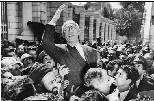
اوج اقتدار کشور در هم صدائی نیروهای ملی و مذهبی

تاریخ به یاد دارد که حکومت مصدق با ملی کردن نفت منافع کشور استعمار پیر را به خطر انداخت و انگلیس همین سناریو امروز را دیروز با تشویق اذهان عمومی جامعه و به خیابان ریختن عده ای اراذل و اوباش به سرکردگی شعبان بی مخ و اجیر کردن گروهی از فاحشه های مشهور قلعه شهرنو نظیر «پری بلنده»، «پری آژدان قزی» و «ملکه اعتضادی» در همراهی با کودتاچیان و با سردادن شعارهای آزادیخواهی «زنده باد شاه» و «مرگ بر توده ای» و «مرگ بر مصدق» از جنوب شهر به طرف خانه مصدق در انتهای خیابان فلسطین، قشون کشی کردند و نهایتاً با سرنگونی دولت مصدق دموکراسی مورد نظر انگلیس برقرار و تمام زحمات انقلابیون در ملی شدن صنعت نفت و بیرون کردن شرکت های نفتی انگلیسی به باد رفت